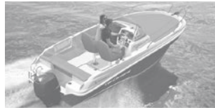
Cap Camarat 5.5 WA